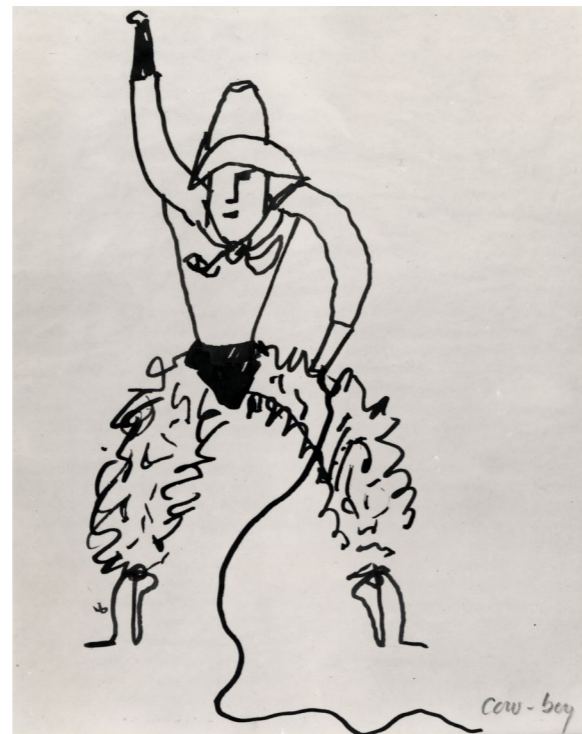
Le Cirque - Cow boy, 1926/32, encre sur papier, 28 x 22 cm. Collection Adrien Maeght © 2026 Calder Foundation, New York / ADAGP, Paris

Calder ne se limite pas à la création du Cirque , il le met en scène et anime des représentations d'environ 2 heures, jouant à la fois le maître de cérémonie, le chef de piste et le marionnettiste. Entre 1926 et 1933, Calder vit à Paris et voyage fréquemment avec son cirque, transporté dans plusieurs valises. Présenté dans des ateliers et chez des amis, il est ensuite exposé à Paris, puis à Berlin et à New York, où il est aujourd'hui conservé au Whitney Museum. Véritable prouesse, le Cirque annonce déjà les recherches de Calder sur l'équilibre et le mouvement.