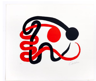
Deux serpents , 1973, lithographie originale en couleurs sur Rives, 56 x 64,5 cm. Collection Adrien Maeght © 2026 Calder Foundation, New York / ADAGP, Paris