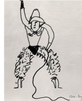
Le Cirque - Cow boy , 1926/32, encre sur papier, 28 x 22 cm. Collection Adrien Maeght © Photos Claude Germain - Archives Fondation Maeght © 2026 Calder Foundation, New York / ADAGP, Paris