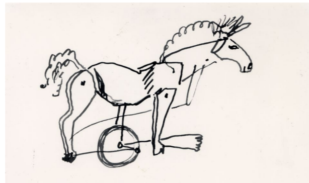
Le Cirque - Cheval, 1926/32, encre sur papier, 28 x 22 cm. Collection Adrien Maeght © 2026 Calder Foundation, New York / ADAGP, Paris

À Paris, Calder s'essaye à la création de petits jouets mécaniques pour les étals d'un vendeur de jouets. Ces premiers jouets sont les ébauches de ce qui deviendra son œuvre emblématique à partir de 1926 : le Cirque Calder . L'ensemble comprend plus de 200 éléments fabriqués avec des matériaux divers (fil de fer, bois, cuir, tissu, ficelle, bouchons de liège), comporte près de 30 attractions et s'organise autour d'une piste de moins d'un mètre de large. Au fil des années, Calder enrichira son cirque en ajoutant de nouveaux personnages et accessoires.