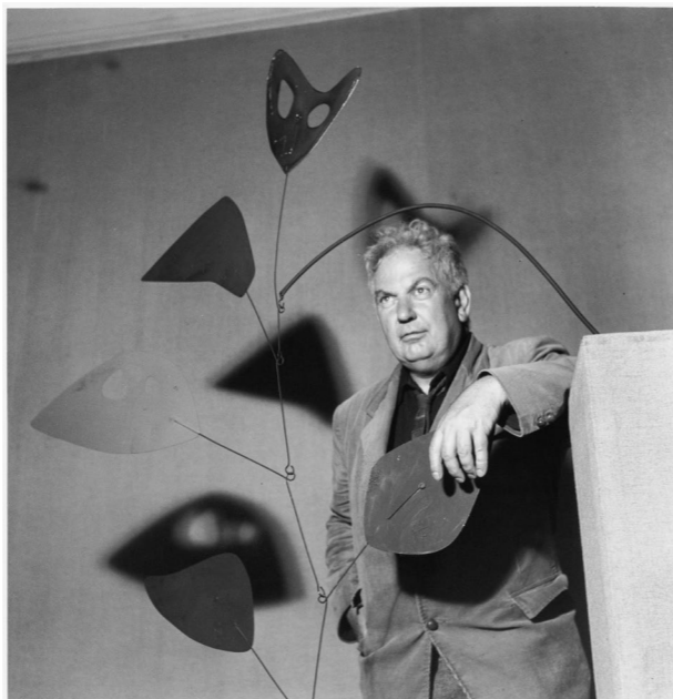
Exposition Calder 1969

Cette exposition, réalisée en partenariat avec la Fondation Maeght, met en lumière la relation essentielle entre Calder et Aimé et Marguerite Maeght dont le soutien a largement contribué au rayonnement de son travail depuis leur première rencontre à Paris en 1947. À travers une sélection de 69 œuvres issues de la collection, cette exposition dévoile gouaches, lithographies, bronzes, encres et mobiles révélant toute la diversité d'un artiste précurseur, qui a su faire du mouvement une œuvre, et de l'équilibre, un art.