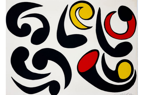
Autres têtards , 1976, lithographie originale en couleurs sur Rives, 58 x 78 cm. Collection Fondation Maeght © 2026 Calder Foundation, New York / ADAGP, Paris