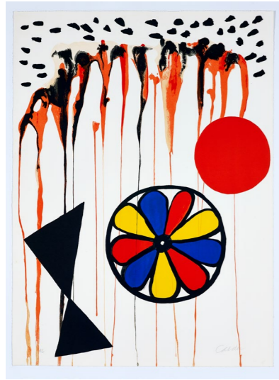
La mousson , 1965, lithographie originale en couleurs sur Rives, 76 x 56 cm. Collection Fondation Maeght © 2026 Calder Foundation, New York / ADAGP, Paris

Toute reproduction ou représentation d'une oeuvre d'Alexander Calder doit être accompagnée des mentions suivantes : © 2026 Calder Foundation, New York / ADAGP, Paris