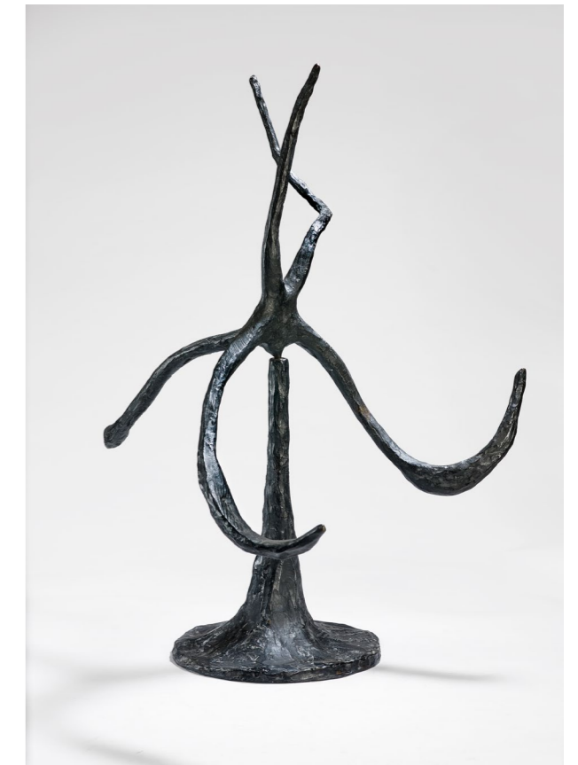
L'étoile de mer, bronze, 86 x 78 x 72 cm. Collection Fondation Maeght © Photos Claude Germain - Archives Fondation Maeght © 2026 Calder Foundation, New York / ADAGP, Paris

Leur amitié perdue jusqu'à la mort de l'artiste en 1976. Aujourd'hui encore, le célèbre stable Les Renforts , réalisé en 1953 en référence à la muraille médiévale du village de Saint-Paul-de-Vence, demeure un symbole fort du lien entre Calder et la Fondation Maeght.