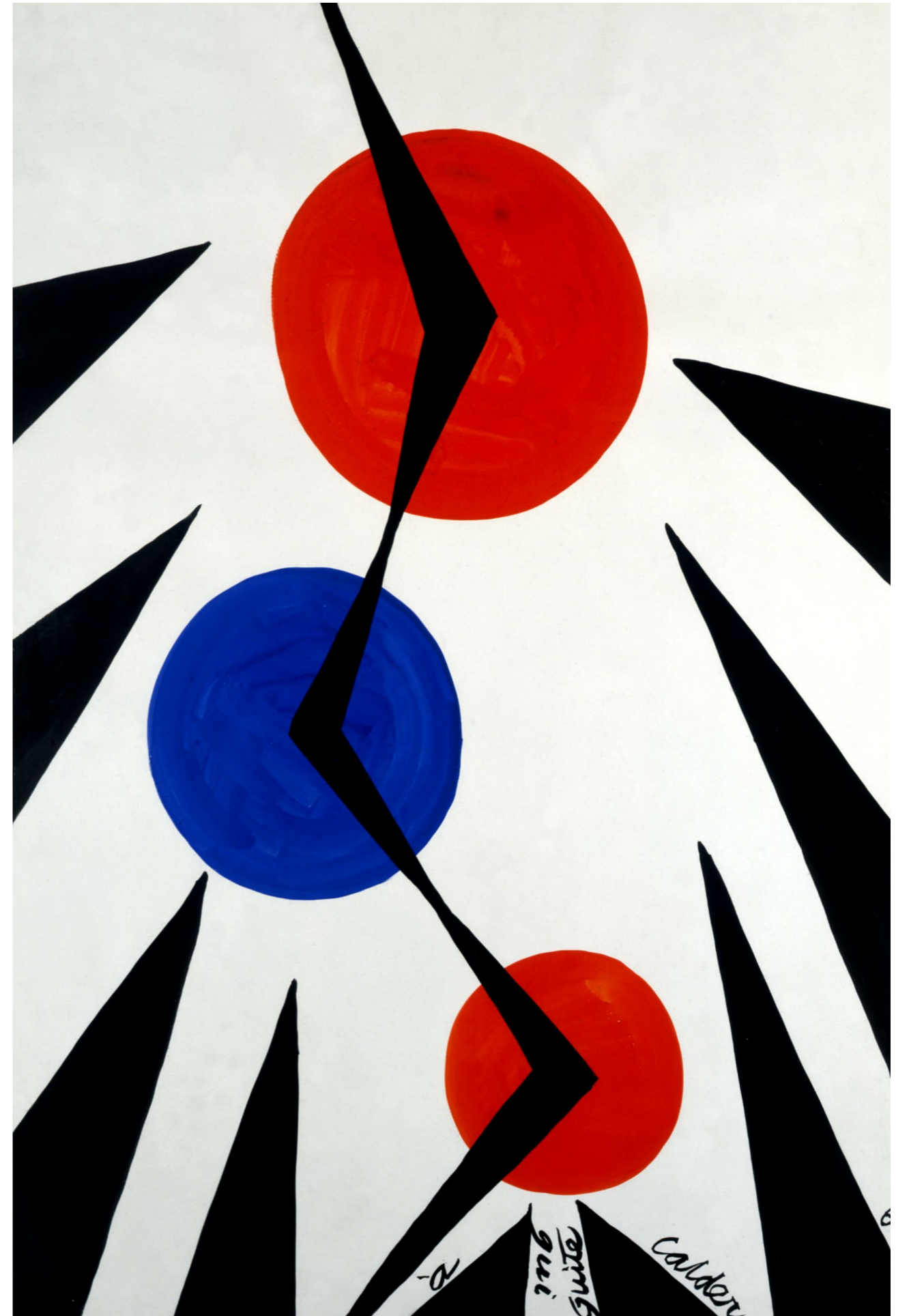
Pour Madame Maeght, 1967, gouache sur papier, 110 x 75 cm. Collection Adrien Maeght © 2026 Calder Foundation, New York / ADAGP, Paris