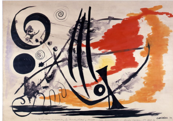
Pour Madame Maeght, 1950, gouache sur papier, 75 x 110 cm. Collection Adrien Maeght © Photos Claude Germain - Archives Fondation Maeght © 2026 Calder Foundation, New York / ADAGP, Paris

Lors de ses études à l'Art Students League de New York, il travaille comme illustrateur pour la presse, il y dessine ses premières scènes de cirques et d'animaux, avant de s'installer à Paris en 1926. Il y découvre alors l'effervescence artistique de l'avant-garde et réalise ses premières sculptures en fil de fer, ainsi que son célèbre Cirque Calder . Sa rencontre avec Piet Mondrian en 1930, marque un tournant décisif. Calder s'oriente alors vers l'abstraction, les couleurs primaires et crée ses premières sculptures en équilibre, donnant naissance à ce qui deviendra sa signature artistique.