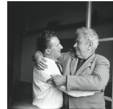
Aimé Maeght et Calder