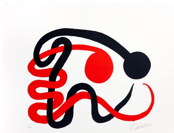
Deux serpents, 1973, lithographie originale en couleurs sur Rives, 56 x 64,5 cm. Collection Adrien Maeght © 2026 Calder Foundation, New York / ADAGP, Paris

Cette importance de la lithographie s'inscrit dans un contexte plus large, de nombreux artistes d'avant-garde l'ont utilisée, car elle permettait à la fois une grande liberté créative et une large diffusion. La famille Maeght a joué un rôle majeur dans cette diffusion artistique, grâce à leur activité d'éditeur et d'imprimeur, ils ont permis la circulation d'œuvres originales en séries limitées, rendant l'art moderne plus accessible aux collectionneurs et au public.