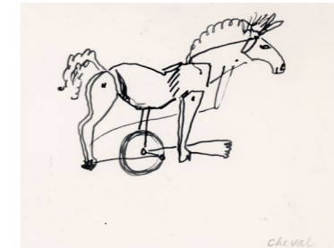
Le Cirque - Cheval , 1926/32, encre sur papier, 28 x 22 cm. Collection Adrien Maeght © Photos Claude Germain - Archives Fondation Maeght © 2026 Calder Foundation, New York / ADAGP, Paris