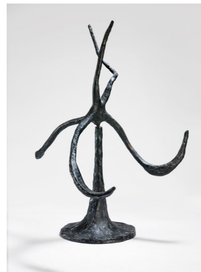
L'étoile de mer , bronze, 86 x 78 x 72 cm. Collection Fondation Maeght © 2026 Calder Foundation, New York / ADAGP, Paris