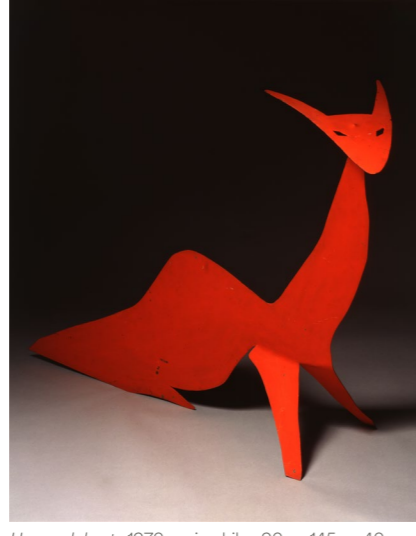
Horned best , 1970, animobile, 90 x 145 x 40 cm. Collection Isabelle Maeght © 2026 Calder Foundation, New York / ADAGP, Paris