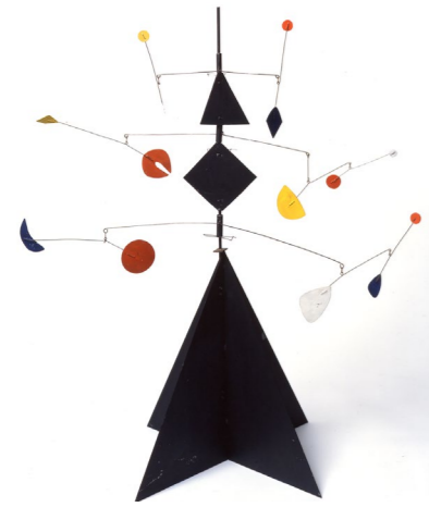
Projet pour un monument , 1950/75, stable mobile, 112 x 98 x 98 cm. Collection Adrien Maeght © 2026 Calder Foundation, New York / ADAGP, Paris