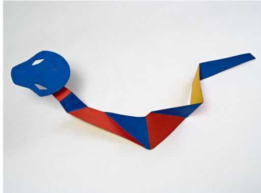
Crinkly Worm , 1970, animobile, 18 x 94 x 40 cm. Collection Jules Maeght © Photos Claude Germain - Archives Fondation Maeght © 2026 Calder Foundation, New York / ADAGP, Paris