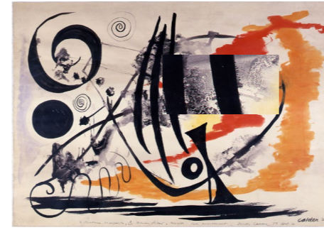
Pour Madame Maeght , 1950, gouache sur papier, 75 x 110 cm. Collection Adrien Maeght © 2026 Calder Foundation, New York / ADAGP, Paris