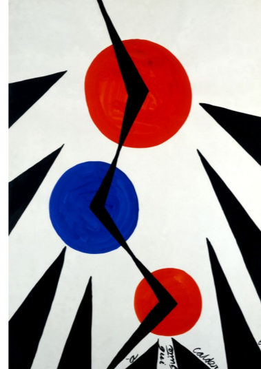
Pour Madame Maeght , 1967, gouache sur papier, 110 x 75 cm. Collection Adrien Maeght © 2026 Calder Foundation, New York / ADAGP, Paris