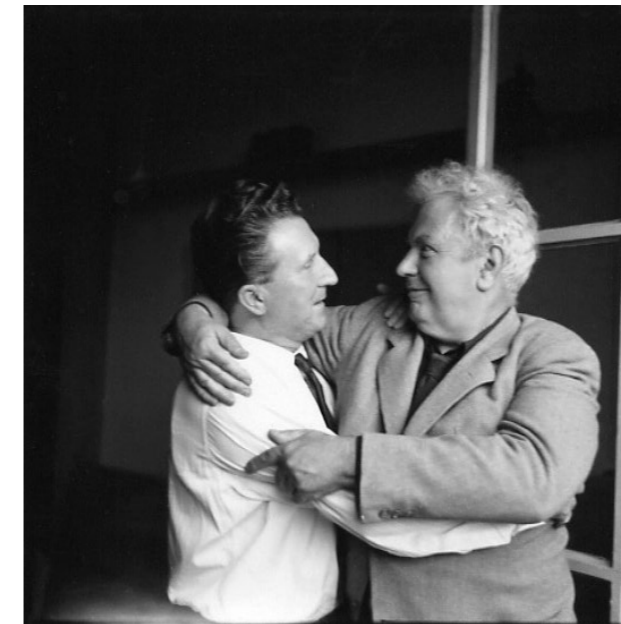
Aimé Maeght et Calder

Le couple Maeght comprend très tôt l'importance de l'édition d'art comme moyen de création et de diffusion. À une époque où l'art reste réservé à un public restreint, il développe à Paris l'imprimerie ARTE-Maeght, qui devient l'un des plus grands ateliers d'estampes d'Europe. L'estampe n'y est plus considérée comme une simple reproduction, mais comme une œuvre à part entière. Durant près de trente ans de collaboration, Calder y réalise plus de 200 lithographies et eaux-fortes pour Maeght Éditeur.