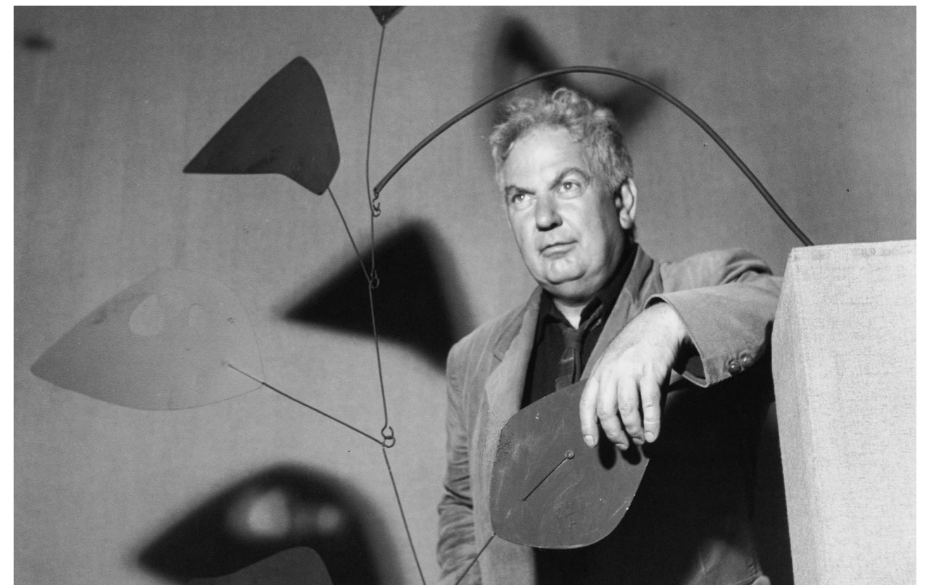
Exposition Calder 1969