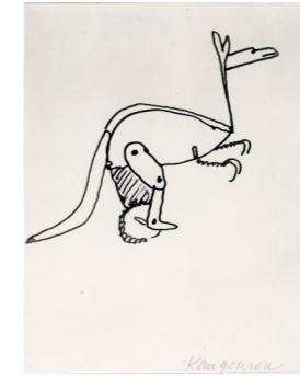
Le Cirque - Kangourou , 1926/32, encre sur papier, 28 x 22 cm. Collection Adrien Maeght © 2026 Calder Foundation, New York / ADAGP, Paris