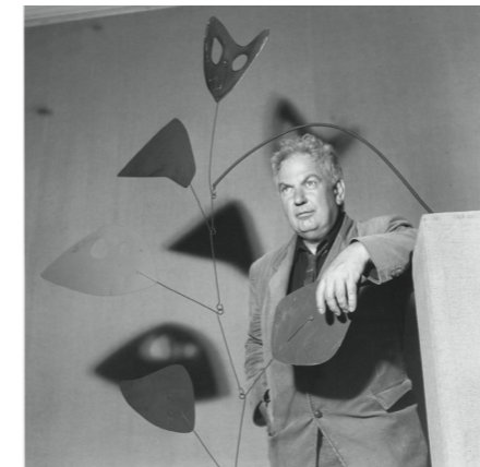
Exposition Calder 1969