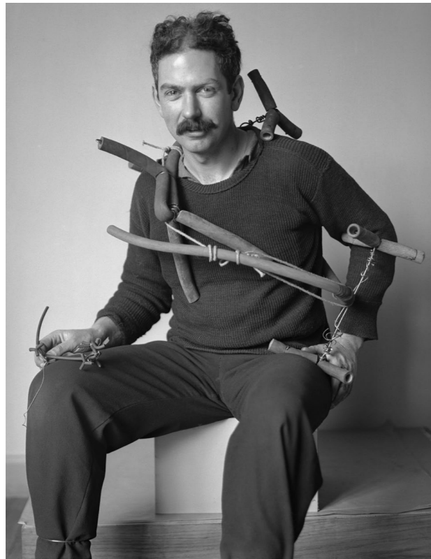
Alexander Calder, 1969

Né en 1898 en Pennsylvanie, au sein d'une famille d'artistes, Calder grandit dans un environnement propice à la création. Il étudie d'abord l'ingénierie mécanique au Stevens Institute of Technology, une formation qui marquera sa recherche artistique autour du mouvement et des jeux d'équilibre. Très vite, il se détourne de cette voie pour se consacrer pleinement à l'art, développant un intérêt particulier pour la précision du geste et les matériaux industriels.