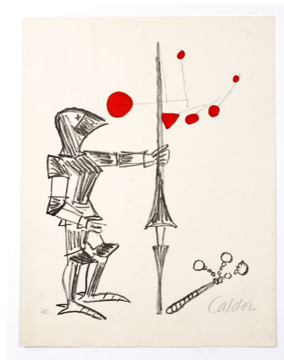
Noble chevalier , 1960, lithographie originale en couleurs sur Rives, 45 x 35,4 cm. Collection Fondation Maeght © 2026 Calder Foundation, New York / ADAGP, Paris