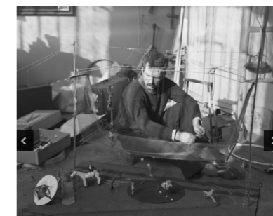
Exposition Calder 1969