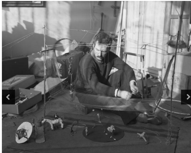
Exposition Calder 1969

Dans les années 1920, installé à New York, Calder travaille comme illustrateur. Il réalise des dessins à l'encre représentant des animaux observés au zoo du Bronx et à Central Park durant l'hiver 1925. Peu après, il se rend en Floride où il découvre l'univers des cirques Ringling Bros. et Barnum & Bailey. Fasciné par les chapiteaux et la grande scène, le cirque deviendra une source majeure d'inspiration. L'exposition dévoile 18 encres sur papier qui retranscrivent le geste fluide, presque abstrait, de l'artiste sur cette thématique.