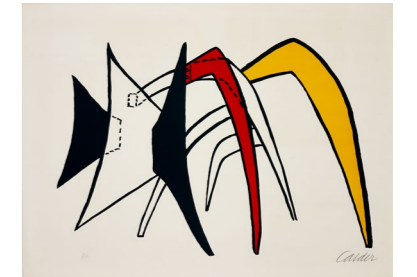
Tamanoir jaune , 1963, lithographie originale en couleurs sur Rives, 48 x 65 cm. Collection Adrien Maeght © 2026 Calder Foundation, New York / ADAGP, Paris