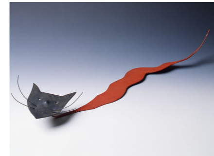
Chat serpent , 1968, stable mobile, 15 x 50 x 22 cm. Collection Isabelle Maeght © 2026 Calder Foundation, New York / ADAGP, Paris