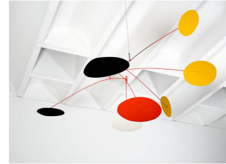
Les trois soleils jaunes , 1965, fer peint, 100 x 233 cm. Collection Fondation Maeght © 2026 Calder Foundation, New York / ADAGP, Paris