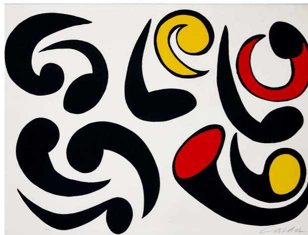
Autres têtards, 1976, lithographie originale en couleurs sur Rives, 58 x 78 cm. Collection Fondation Maeght

Avant même d'être reconnu comme l'inventeur des célèbres mobiles, Alexander Calder développe une pratique importante du dessin et de la peinture sur papier. Parmi ses techniques favorites, la gouache occupe une place essentielle. Cette peinture opaque, rapide à appliquer et très vive en couleur, lui permet de travailler librement les formes et les contrastes. Il appréciait tellement cette pratique qu'il surnomma son atelier de Saché, en Touraine, la « gouacherie » en référence à son ancienne utilisation en porcherie.