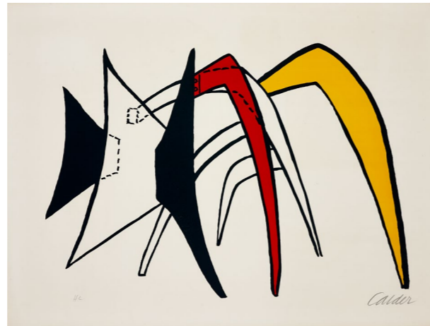
Tamanoir jaune, 1963, lithographie originale en couleurs sur Rives, 48 x 65 cm. Collection Adrien Maeght © Photos Claude Germain - Archives Fondation Maeght © 2026 Calder Foundation, New York / ADAGP, Paris

Calder ne travaille pas directement sur la pierre lithographique. Il réalise des gouaches qui servent de matrice à la lithographie. Elles sont ensuite reportées sur une plaque par un spécialiste, souvent un chromiste, qui prépare une séparation par couleurs. L'artiste intervient ensuite en donnant son accord sur les épreuves avant le tirage final.