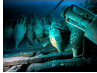
Sentier sous-marin archéologique de la Tour Fondue, pointe du Bouvet