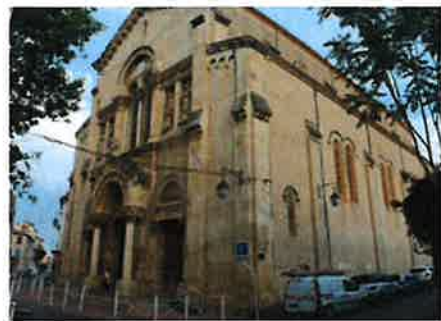
Les faits ont eu lieu devant l'église Saint-Joseph, dans le quartier du Pont du Las, à Toulon.