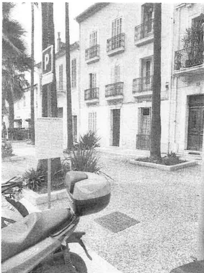
Annexe n°1 - 64 avenue Gambetta