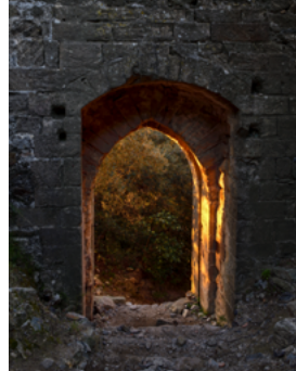
Focus en forêt, vers la potence