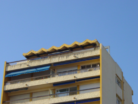
La toiture-vague du Roqueirol