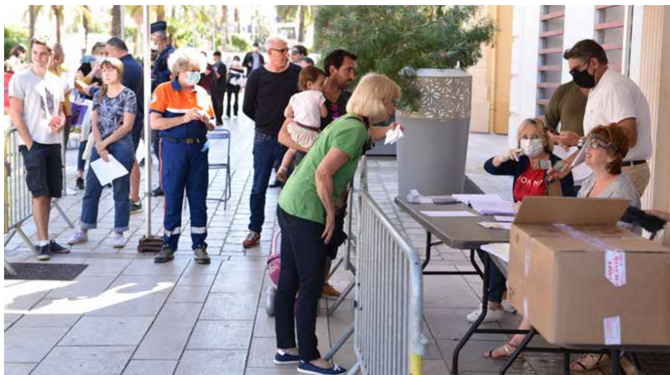
Distribution de masques réutilisables en mai 2020 pour l'ensemble des Hyérois.

JPG : Sous réserve d'une situation sanitaire que l'on souhaite meilleure, un certain nombre de travaux seront achevés ou initiés :