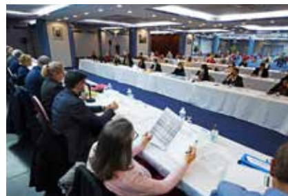
Conseil Municipal délocalisé au Forum du Casino

JPG : Il est vrai que des recours de particuliers peuvent retarder des réalisations d'intérêt général et j'espère que ceux qui les ont formés y renonceront après réflexion et explications.