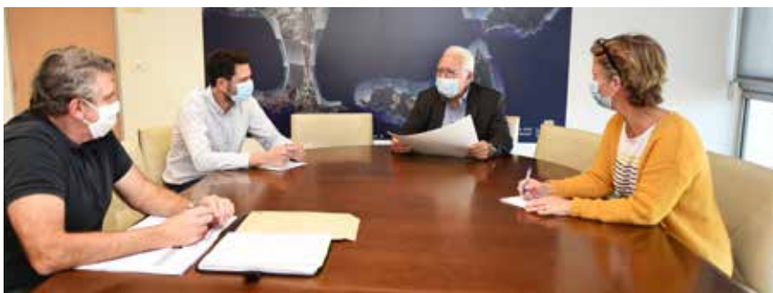
Réunion quotidienne de la cellule de crise

JPG : Je pense bien entendu aux commerces de proximité et notamment aux cafés et restaurants. Je pense à l'horticulture aussi et d'une façon plus générale à tous les acteurs économiques de la ville.