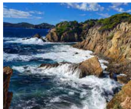
Prix Spécial "Instagram" : Plus de likes La Polynésie, Raphaël Outin (@raphael.outin)