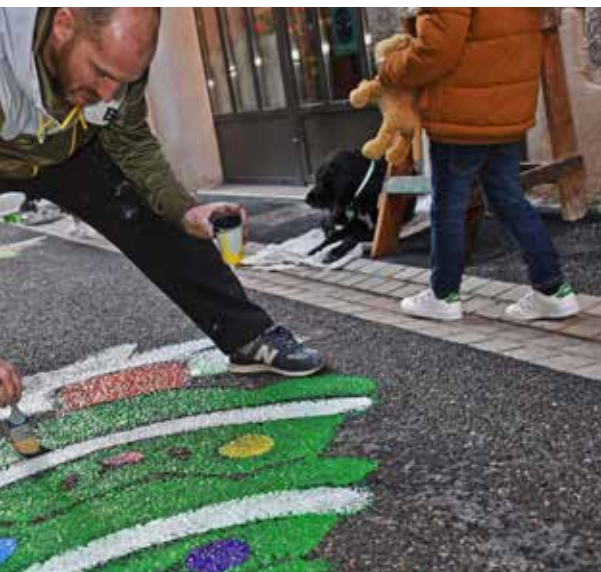
Street Painting sur le thème de Noël au sein du Parcours des Arts.