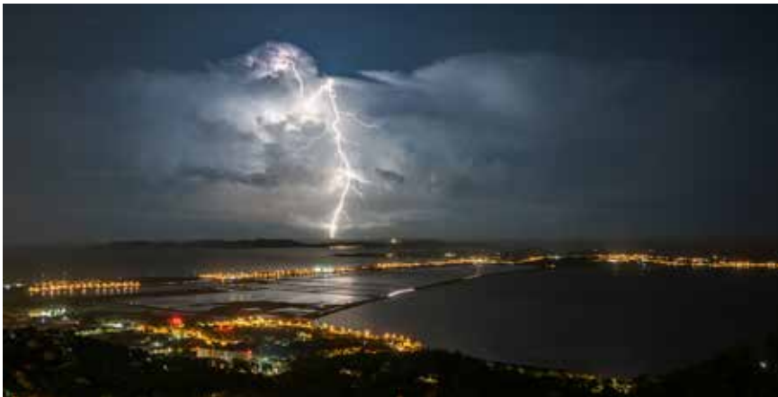
1 er Prix Catégorie "Mauvais temps" - Extranuageux derrière Giens, Hervé Dermoune