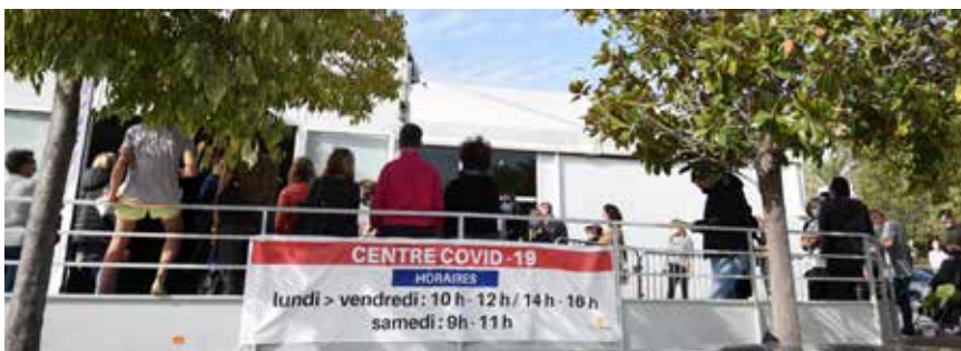
Centre de dépistage Covid-19 à l'espace Vilette