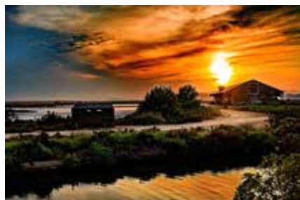
1 er Prix Catégorie "Instagram" - Un ciel flamboyant comme un feu de cheminée au dessus du Salin des Pesquiers, Geneviève Canales (@c.dgene.photography)