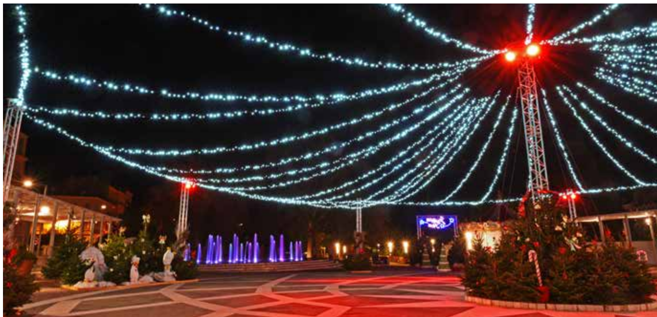
Un magnifique dôme lumineux a été installé sur la place Clemenceau.

La ville s'est illuminée pour les fêtes de fin d'année. La programmation des animations a été établie en fonction des contraintes sanitaires et en accord avec les services de l'Etat. Ces animations ainsi que les illuminations ont permis de conserver malgré tout une atmosphère de fête.