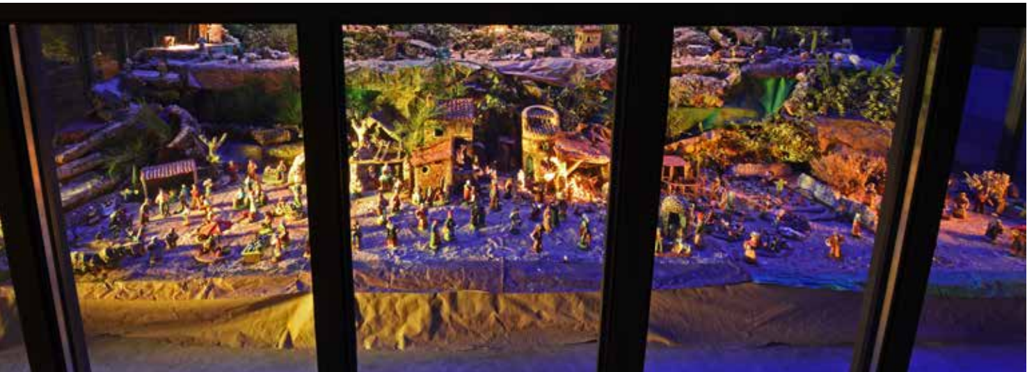
Une crèche provençale a été installée à la Galerie des Arts, place Massillon, éclairée et visible de l'extérieur.