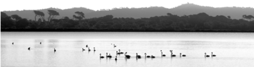
2 e Prix Catégorie "Noir et Blanc" - Flamingos, Elisabeth Rihouay