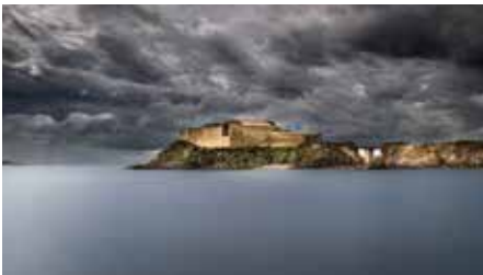
2 e Prix Catégorie "Mauvais temps" Ciel menaçant sur la Tour Fondue, Erwan Lemarié