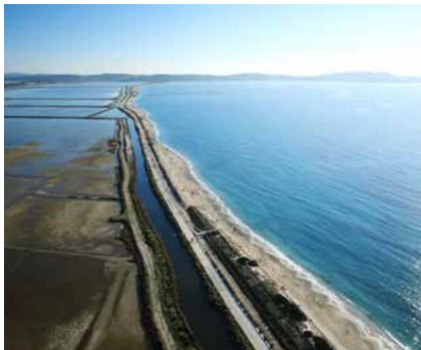
Opération Grand Site Presqu'île de Giens et Salins d'Hyères

Pour l'été, devraient s'achever les travaux du Musée de la Banque de France.