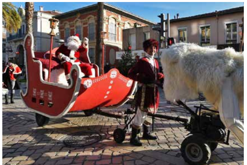
Déambulation du Père Noël en centre-ville.