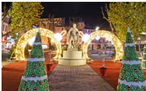
De nouvelles arches lumineuses à l'entrée de la place Clemenceau.