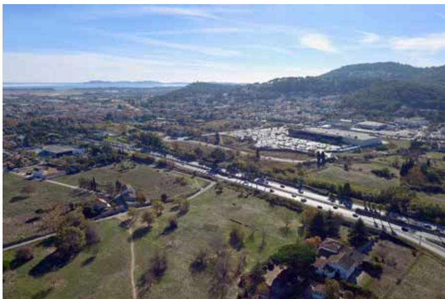
Zones de la Crestade et du Roubaud

Il est grand temps, me semble-t-il, que les instances judiciaires ne soient plus utilisées comme moyen de retarder la mise en œuvre des choix de la démocratie.