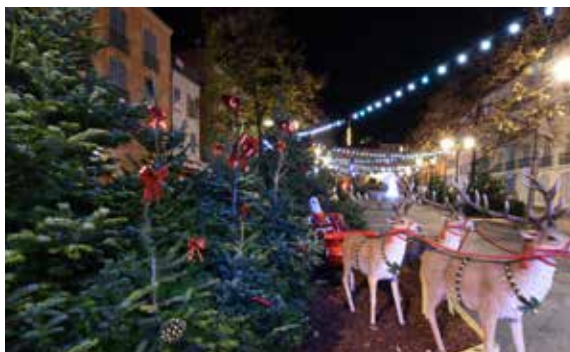
Des compositions végétales décorées sur la place de la République.