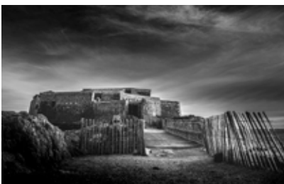
1 er Prix Catégorie "Noir et Blanc" Fascinante forteresse, Caroline Gabas

L'Opération Grand Site (OGS) est la démarche proposée par l'État et retenue par la Ville d'Hyères afin d'améliorer l'accueil des visiteurs et l'entretien du site classé de la Presqu'île de Giens, soumis à une forte fréquentation. Elle permet de définir un projet concerté de restauration, de préservation et de mise en valeur de notre territoire. Depuis le 1 er janvier 2019, cette démarche est portée par la Métropole Toulon Provence Méditerranée.