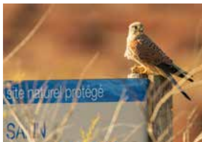
2 e Prix Catégorie "Instagram" Faucon Crécerelle et son petit Mulot, Sébastien Pinna (@wtf_whatthefoto)