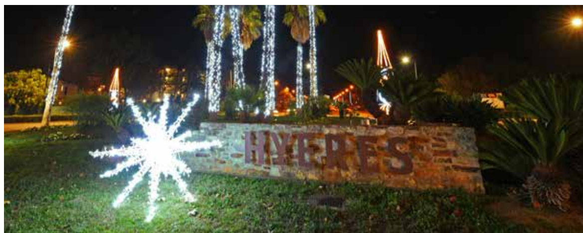
Le rond-point Petit, une entrée de ville mise en lumière.