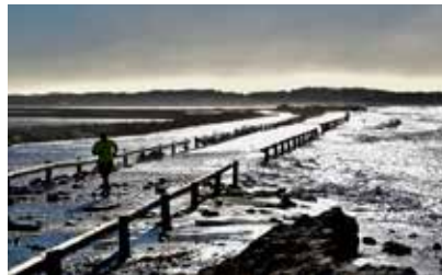
3 e Prix Catégorie "Mauvais temps" Tempête route du sel, Alain Chevrier