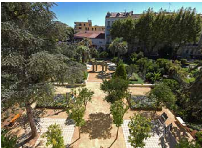
Inauguration du jardin de la Banque, Musée des Cultures et des Paysages