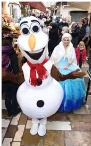
Déambulations et animations ont été organisées pour le grand bonheur des plus petits.