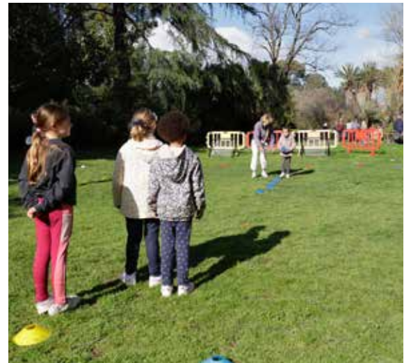
La Chasse aux Œufs de Pâques : en famille et en plein air, la traditionnelle chasse aux œufs s'est déroulée le lundi de Pâques au Jardin Olbius Riquier sur une thématique sportive.