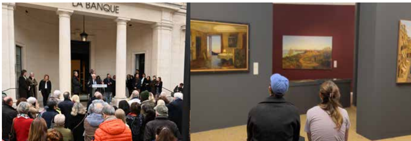
Inauguration de l'exposition Vinardel au Musée La Banque : le public était nombreux à assister à l'inauguration de la nouvelle exposition temporaire du Musée La Banque. L'exposition « Terra Incognita » de Pascal Vinardel, qui nous plonge dans une exploration d'un continent intérieur fait d'aubes et de crépuscules, est visible jusqu'au 19 mai.