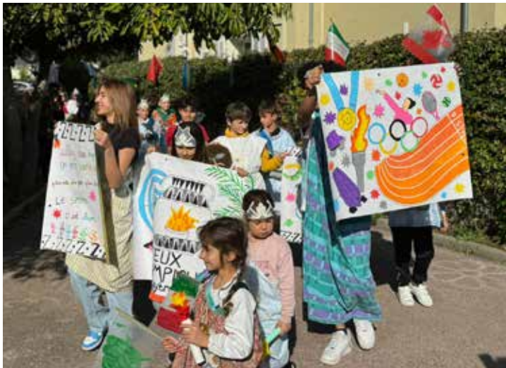
Hyères en Récré fête les JO : ateliers participatifs et créatifs, animations, jeux ludiques et sportifs, escape game et smoothiclette étaient au programme pour les petits athlètes hyérois durant les vacances de février.