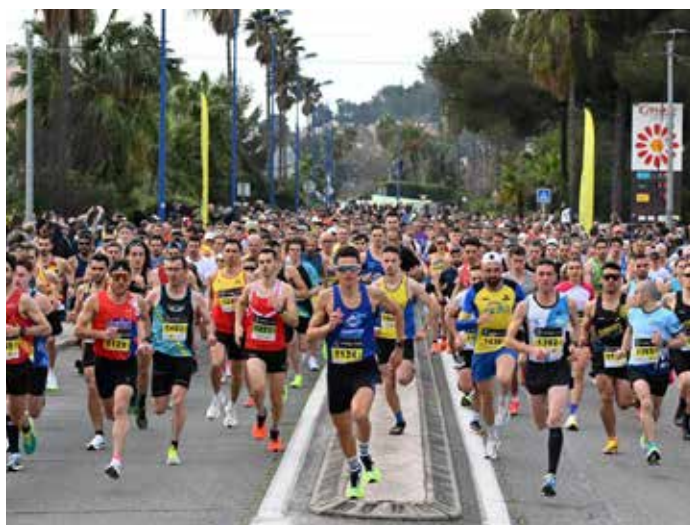
Semi-Marathon de Hyères : plus de 2300 sportifs ont participé aux 3 courses chronométrées sur parcours ultra-plat.