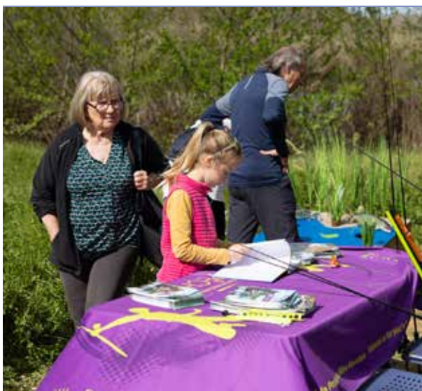
La Fête des zones humides : visites et animations vous ont permis de découvrir des sites naturels exceptionnels comme les étangs de Sauvebonne, la Lieurette, les Vieux Salins ou encore le Salin des Pesquiers.