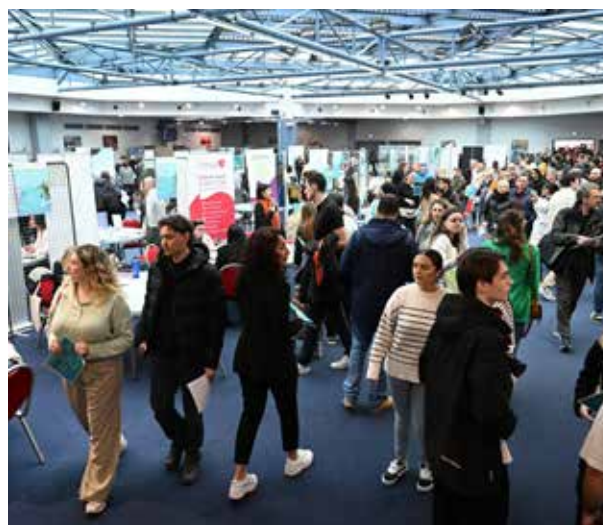
Job'In Hyères : près de 2000 visiteurs sont venus rencontrer et échanger avec les 80 entreprises présentes et proposant plus de 1000 postes à pourvoir lors du Forum de l'Emploi.