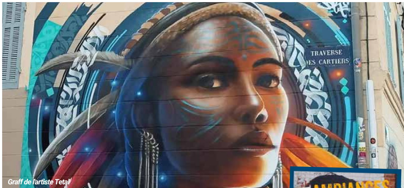
Graff de l'artiste Tetali

Les arts urbains, ou street art, seront à l'honneur lors de la 1 re édition du Festival Ambiance Urbaines ! Le centre-ville et la place Clemenceau seront le terrain de jeu d'artistes, de créateurs et de sportifs pour qui la Ville d'Hyères sera un outil d'inspiration, de pratiques et d'expressions artistiques.