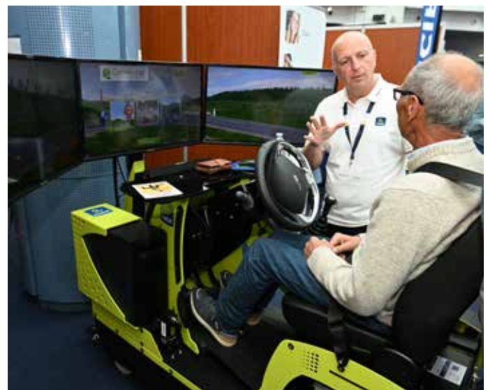
Le Salon Santé-Si Senior : organisé par le CCAS et le service Santé de la Ville, le salon dédié au bien-vivre a accueilli plus de 450 visiteurs allant du junior au senior.