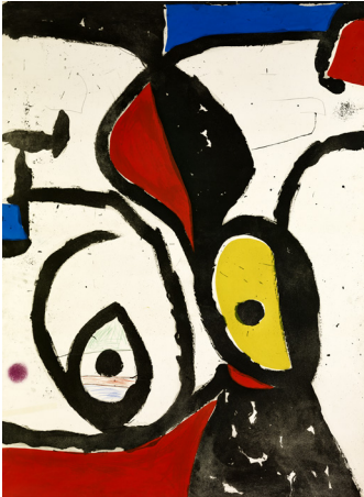
Joan MIRÓ La Pierre philosophale - 1975 Gouache, Pastel, Crayon de couleur édité par Maeght [Paris] INV3568 Photos Claude Germain - Archives Fondation Maeght © Successió Miró / ADAGP, Paris, 2024