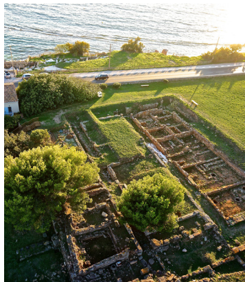
Site archéologique d'Olbia

Le saviez-vous ? La flamme olympique de 2024 passe au Site archéologique d'Olbia.