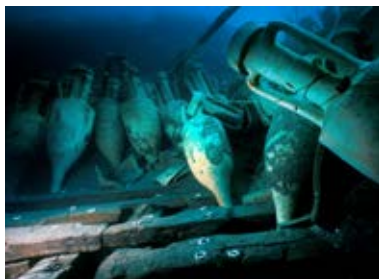
La Madrague de Giens