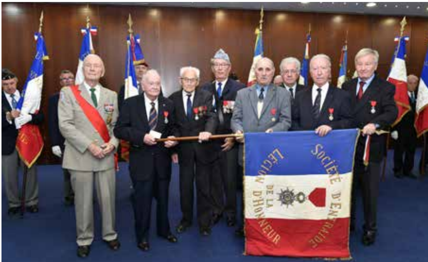
Remise de la légion d'honneur en mars 2019