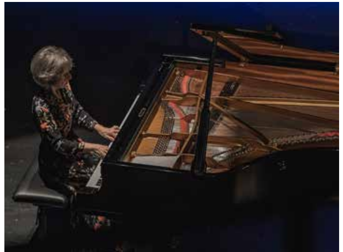
Pour son dernier concert de l'année, le théâtre Denis a accueilli Anne Queffelec, pianiste internationalement reconnue. Pour les prochains spectacles de la Saison artistique, réservez vos places en ligne sur hyeres.fr/billetterie ou au Quai, place Clemenceau.