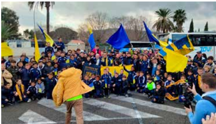
Le 8 janvier, à l'occasion du match de 32 e de finale de Coupe de France entre le Hyères Football Club et l'Olympique de Marseille, la Ville d'Hyères a financé la location de 6 bus permettant aux jeunes licenciés du HFC et à leurs formateurs d'aller supporter leur équipe.