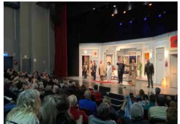
La pièce de théâtre "Espèces menacées" avec Laurent Ournac a fait salle comble à l'auditorium du Casino et a régalé un public nombreux.