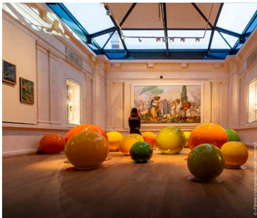
La Banque, musée des cultures et du paysage - exposition permanente

Il faut donc que le gouvernement fasse évoluer la loi pour éviter que l'impatience des citoyens ne se transforme en agressivité.