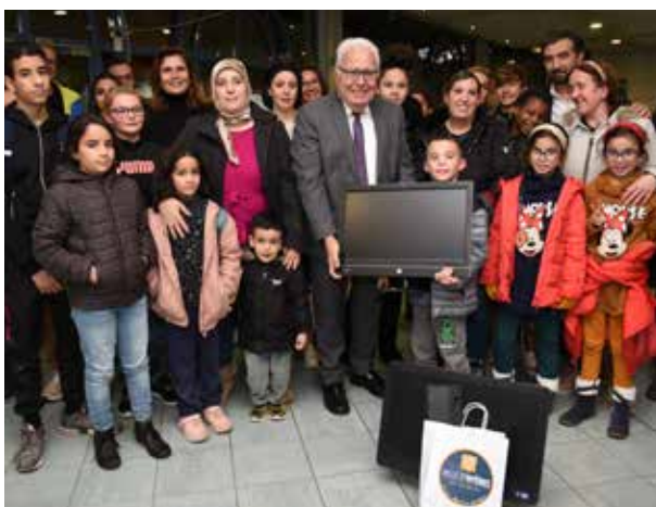
Dans le cadre de l'opération « Cité éducative, un ordinateur pour réussir », des ordinateurs recyclés du parc informatique de la mairie ont été remis à 45 familles hyéroises non équipées en numérique, à revenus modestes et ayant au minimum un enfant scolarisé dans un établissement scolaire du second degré.