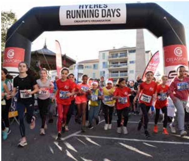
Le Cross des Lutins a clôturé le festival de foulées Hyères Running Days qui a eu lieu début décembre. Dans le cadre de cette course, chaque enfant participant a fait don d'un de ses jouets. Jouets ensuite récoltés par une association et distribués à Noël aux enfants qui n'ont pas la chance d'en avoir.