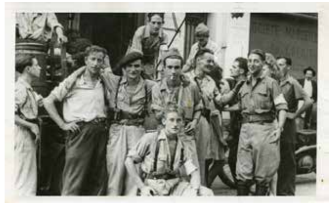
Plusieurs résistants du Maquis Vallier à la Libération.

■ 2019 : Nommé chevalier de la Légion d'honneur