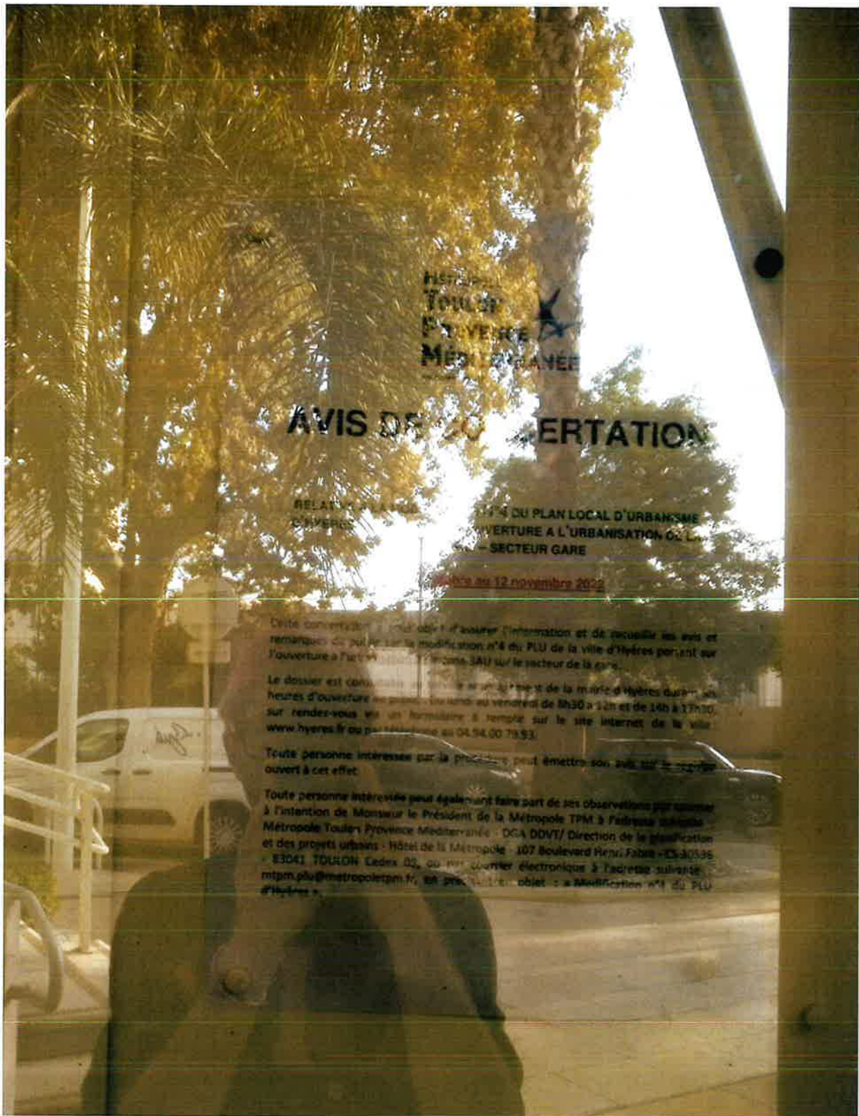
Hôtel de la Métropole - 107 Boulevard Henri Fabre, Toulon