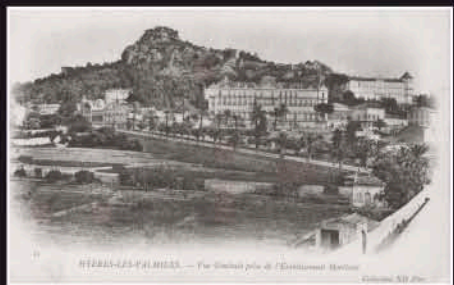
HYÈRES-LES-PALMIERS. — Vue prise près de l'Établissement Hôtelier.

Construit en 1850, ce "palais", entouré de jardins luxuriants, comprend 100 chambres, une salle à manger de 200 personnes, un jardin d'hiver et de magnifiques salons. Ses fenêtres portent sans obstacle jusqu'aux collines qui entourent la vallée, jusqu'à la rade et aux Iles d'Hyères. En 1855-1856, 45% de la clientèle hôtelière réside dans cet établissement, reléguant ainsi les hôtels d'Europe et des Ambassadeurs au rang de pensions de famille.