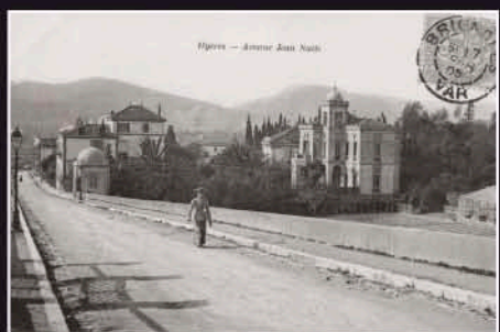
Hyères — Avenue Jean Natte.

L'intervention d'Alexis Godillot a donc complètement transformé le quartier : des boulevards sont créés au flanc de la colline et des plaines, le long desquels s'élèvent quantités de villas plus coquettes les unes que les autres, ainsi qu'une étrange habitation : le Chalet Norvégien. Alexis Godillot le fait venir après l'Exposition Universelle de Paris de 1867. Il est érigé sur le terrain qui s'étend sur la colline du Noviciat jusqu'au boulevard de la Pierre Glissante.