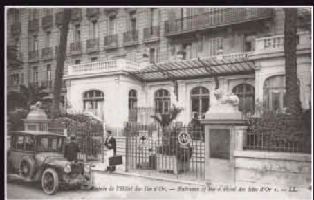
Entrée de l'Hôtel des Iles d'Or. — Vue prise de l'île d'Or n. — 12.