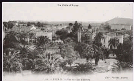
La Côte d'Azur

La Villa Mauresque, de type éclectique et pittoresque, construite en 1881 par l'architecte Pierre Chapoulard pour Alexis Godillot, est destinée aux réceptions données par l'industriel, mais aussi à la location aux hivernants.